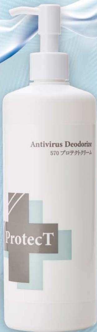
570 プロテクトクリーム (無香料) 500 ml